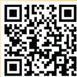
Aplikasi Ventour Mobile